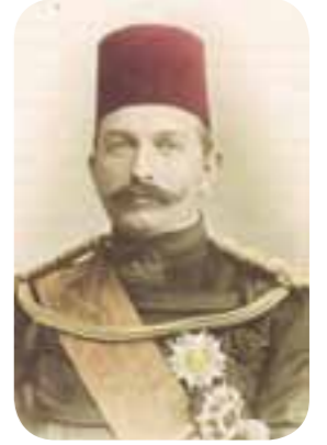
Mısır Hıdivi Abbas Hilmi Paşa.

Buna karşın Münire Hanım çok yumuşak ve sessiz bir insandı. Aşının sözünde çıkmamaya büyük özen gösteren, ev kadını ve çocuğunun annesi olmak konusunda elinden gelenin en iyisini yapmaya çalışan bir kadın oldu. Ev işlerinin idaresinde bir "vilharç" rolü oynardı; evdeki aşçı ve diğer erkek çalışanlarla doğrudan konuşmaması, gradaki iletişimi vekilharç sağlardı. Bir gün Perizat'la Cemal Bey'in üst kat balkonunda evcilik oynarken Perizat'la Cemal Bey'in konuştuğu, ama şans