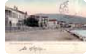
1900'lerin başında İzmir'den bir görünüm.