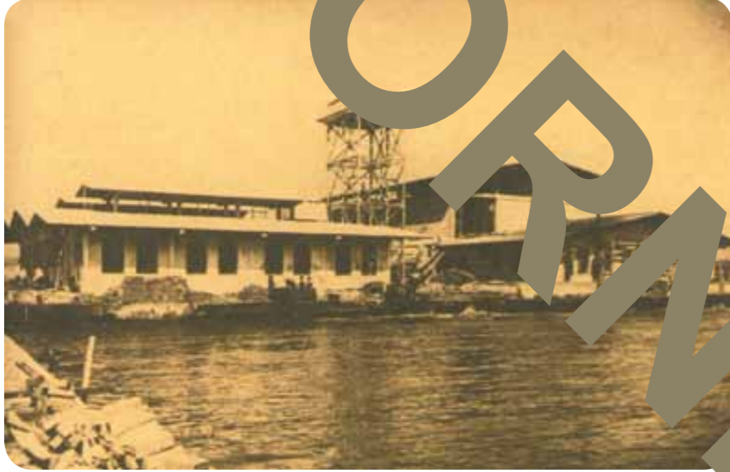
Cemal Bey'in müdürlüğünü yaptığı salhane.

eseri balkonun önündeki ağacın dalına takılarak kurtuldu; kızın çığıklarına Münevver Hanım'la birlikte aşçı da koşunca, ilk kez birbirlerinin yüzünü görmüş oldular.